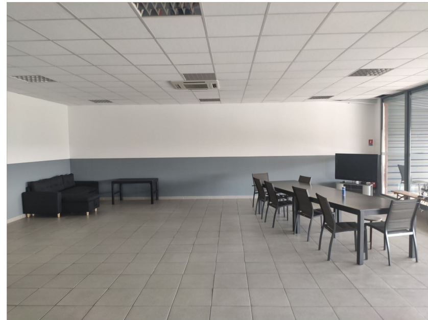
Salle de pause