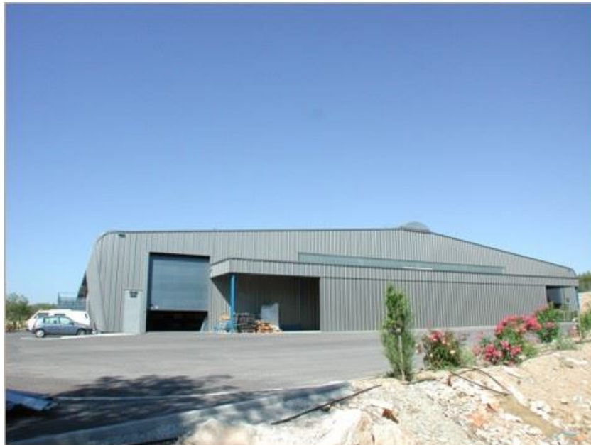
Terrain de stockage