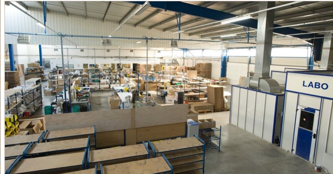
Mezzanine de stockage