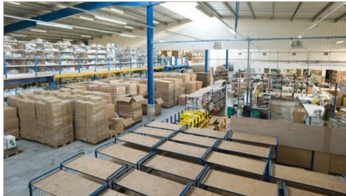
Mezzanine de stockage