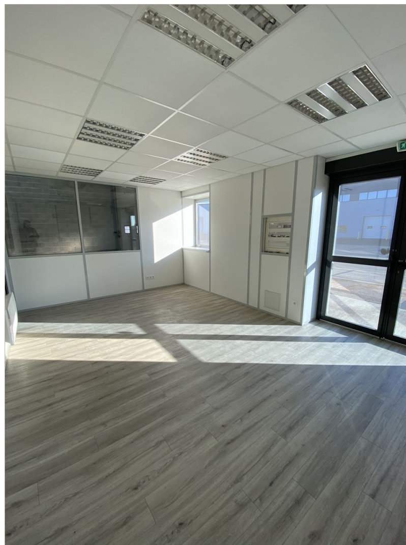
Bâtiment b - cellule 7

NCT (anciennement dénommée Nexity Conseil et Transaction) - CONSEIL EN IMMOBILIER D'ENTREPRISE - Société par actions simplifiée au capital de 120 000 € - RCS Paris B 431 315 159 - SIRET : 431 315 159 00191 Siège Social : 43-47 avenue de la Grande Armée - CS 61714 - 75782 Paris cedex 16 - garantie financière auprès de la société C.E.G.C dont le siège social est 16 rue Hoche -Tour Kupka B - TSA 3999 - 92919 LA DEFENSE Carte professionnelle « Transactions sur Immeubles et Fonds de Commerce » n° CPI 7501 2015 000 001 959 délivrée par la CCI de Paris Ile-de-France Les informations sur les risques auxquels ce bien est exposé sont disponibles sur le site Géorisques : www.georisques.gouv.fr