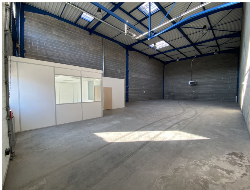
Bâtiment b - cellule 7