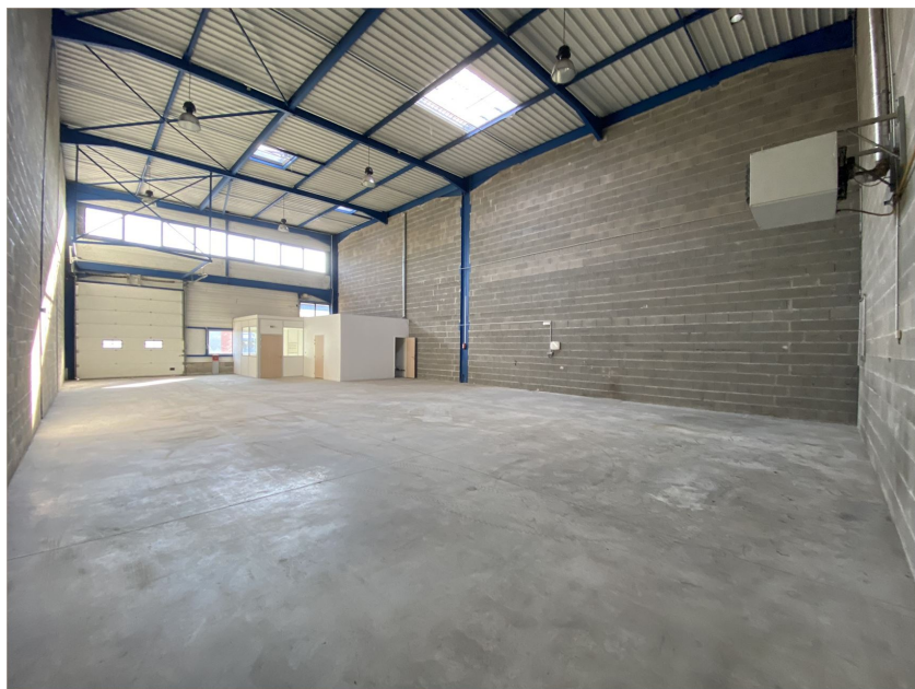
Bâtiment b - cellule 7